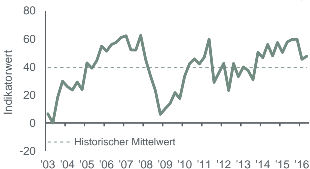
German Private Equity Barometer – Geschäftsklima